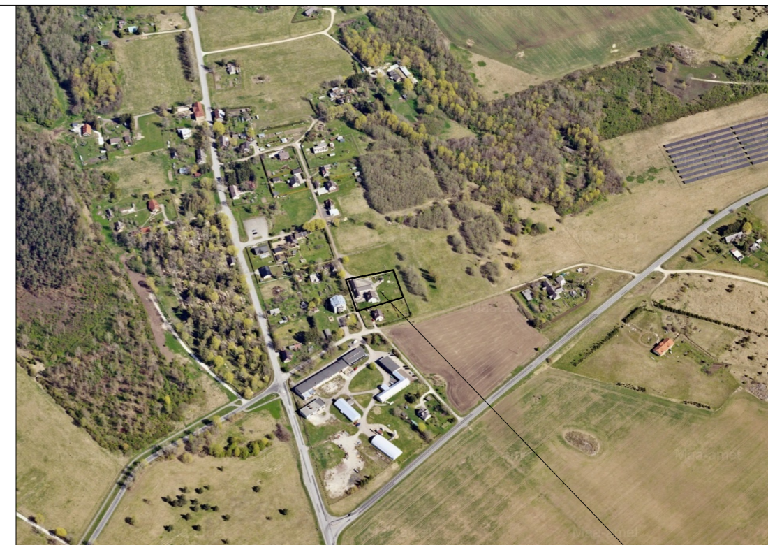
PAE TN 2a KATASTRÜKSUSE ASUKOHT